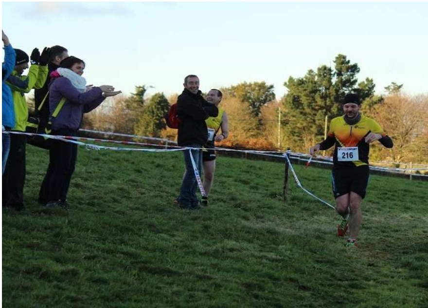
Cross LTA 2015