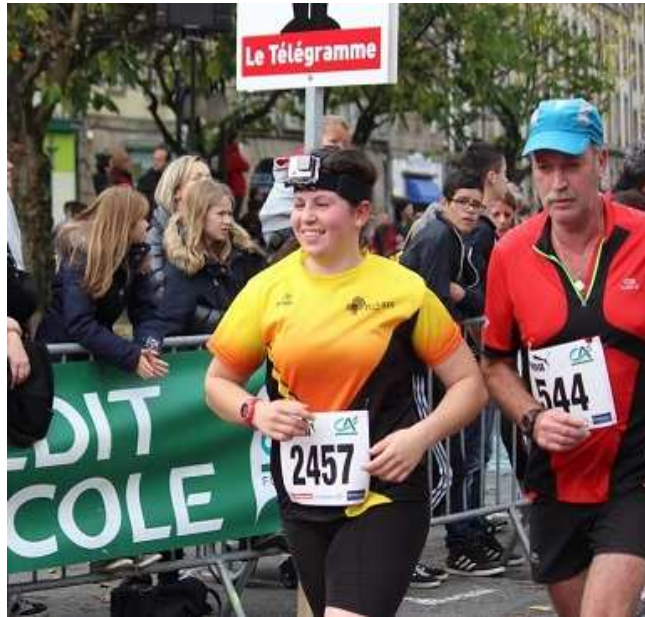
Le Taulé – Morlaix 2015